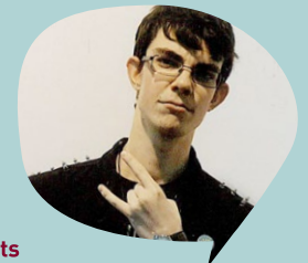
CLÉMENT Bénévole concerts

"J'ai découvert La CLEF en 2019, quand j'ai emménagé à St-Germain-en-Laye. J'ai cherché à en savoir plus sur ce qui se faisait sur la ville et je n'ai pas eu à fouiller très longtemps pour entendre parler de La CLEF ! J'ai commencé par aller à une soirée Warm'up où j'ai pu discuter avec l'équipe et les bénévoles, découvrir les lieux et toucher du doigt la diversité des activités et événements que propose l'association. Et tout de suite, ça m'a parlé, je m'y suis sentie bien et j'ai voulu participer. C'est comme ça que je suis devenue bénévole concert, puis l'année d'après déléguée associative et comme j'avais envie de m'impliquer d'avantage, cette année je me suis portée volontaire pour être au conseil d'administration (ah oui, je fais aussi de la sculpture !) : le full package quoi ! Bref, La CLEF, c'est un univers très riche et dynamique, de belles découvertes, qu'elles soient humaines ou culturelles, qui me donnent encore et toujours envie de faire partie de l'aventure !"